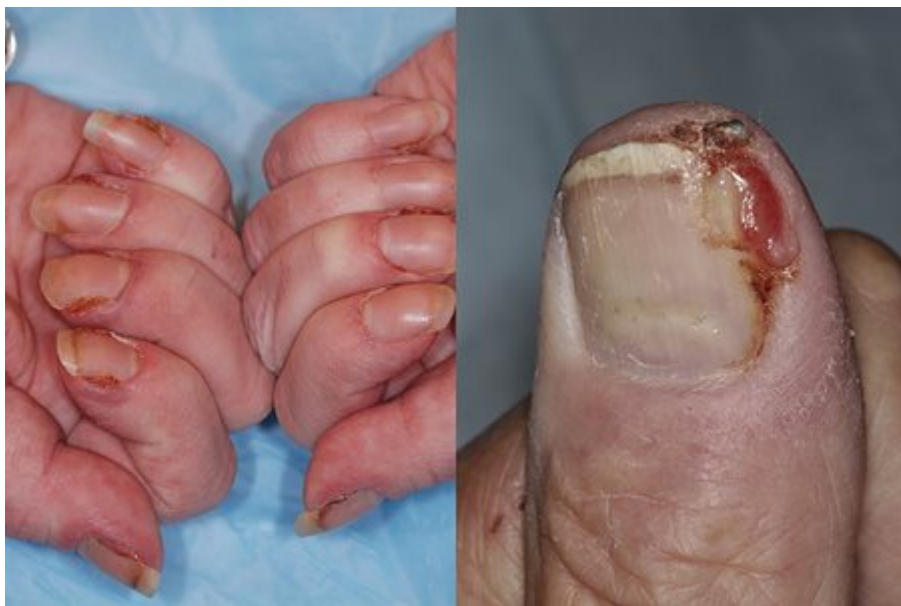
© J Am Acad Dermatol 2012 3

The presence of pus may be an indication of bacterial infection.(膿液的存在可能表明細菌感染。)